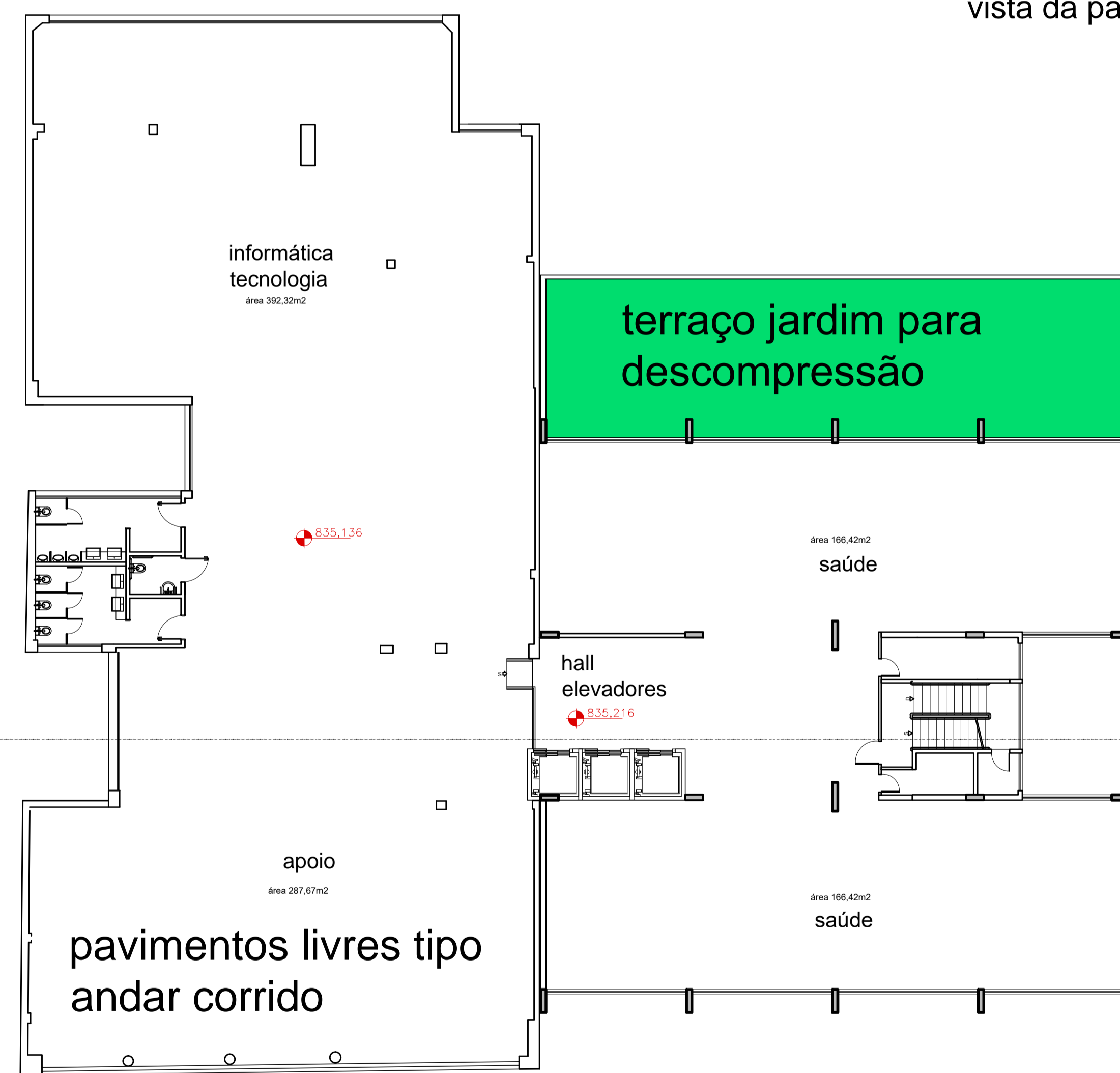
B1 B2 1o PAVIMENTO área 1.247,80m 2