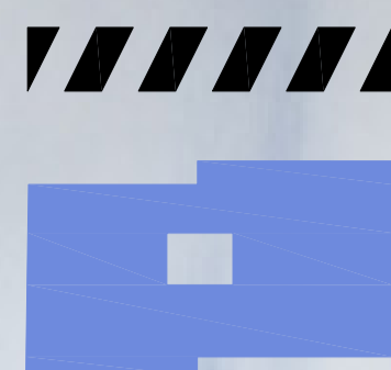
IMPLANTAÇÃO PROPOSTA - PARTIDO