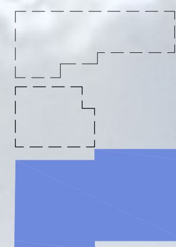
SITUAÇÃO INICIAL DO CONJUNTO