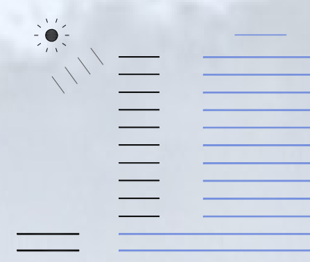
CORTE LONGITUDINAL - PARTIDO